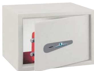
TSK / 2

La Asociación Española de Normalización y certificación (AENOR) ha certificado que el Sistema de Gestión de la Calidad adoptado por Ferrimax, s.a. para el diseño, la producción, la comercialización, el servicio post-venta y el mantenimiento de cajas fuertes y productos de seguridad física es conforme a las exigencias de la nueva norma EN ISO 9001:2000.