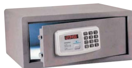
TSW / 4H