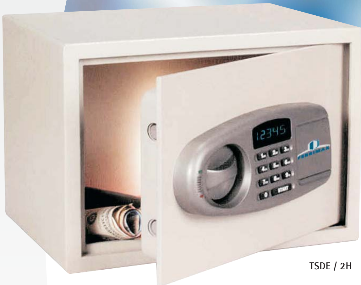
TSDE / 2H

La Asociación Española de Normalización y certificación (AENOR) ha certificado que el Sistema de Gestión de la Calidad adoptado por Ferrimax, s.a. para el diseño, la producción, la comercialización, el servicio post-venta y el mantenimiento de cajas fuertes y productos de seguridad física es conforme a las exigencias de la nueva norma EN ISO 9001:2000.